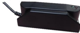
TCMAG2-USB: Leser von ISO Magnetkarten