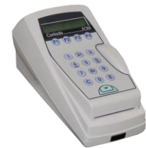
TCRS: Leser von CARTADIS-Magnetkarten, die nur mit der cPad-Pay-Version kompatibel sind