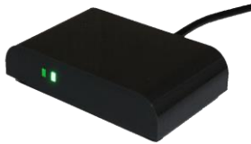
TCM3/TCM4: Leser von 13.56 Mifare or 125 KHz kontaktlose Karten